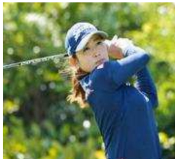
田村 亜矢 プロ