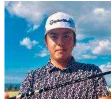
幡地 隆寛 プロ