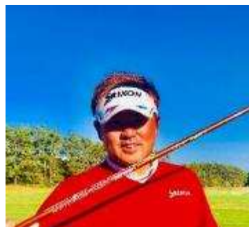
秋吉 翔太 プロ