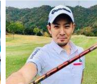
塩見 好輝 プロ