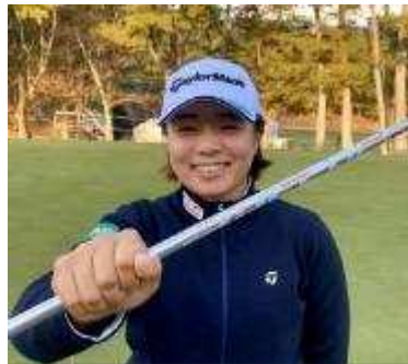
永峰 咲希 プロ